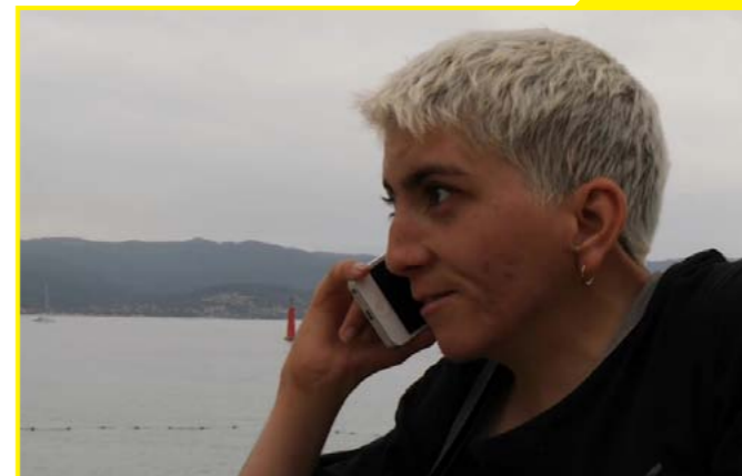
« Les paparazzis vont partir, ça y est, enfin ... »