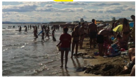
Add a Title ARRI ALEXA Plus 4:3 1.78 (16:9) Cooke S4/i 50 mm