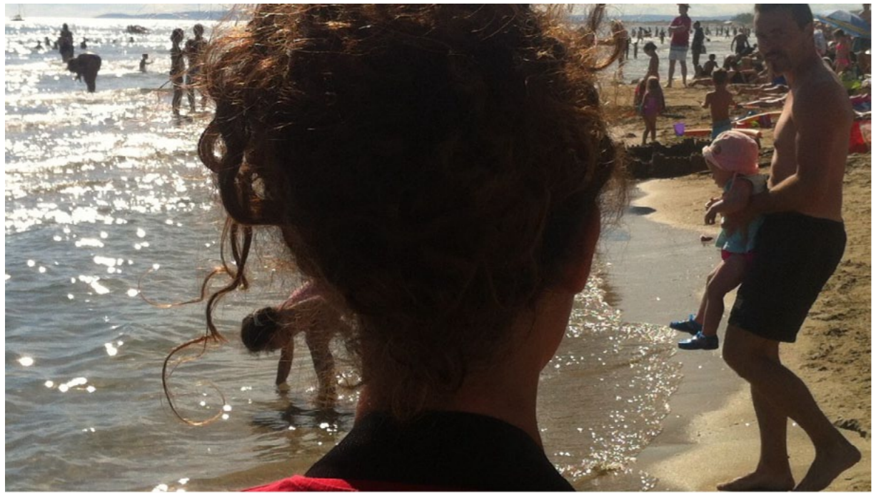
Add a Title ARRI ALEXA Plus 4:3 1.78 (16:9) Cooke S4/i