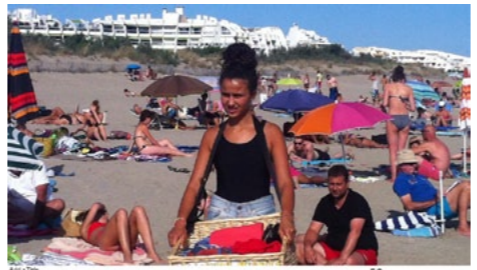
Add a Title ARRI ALEXA Plus 4:3 1.78 (16:9) Cooke S4/i 50 mm