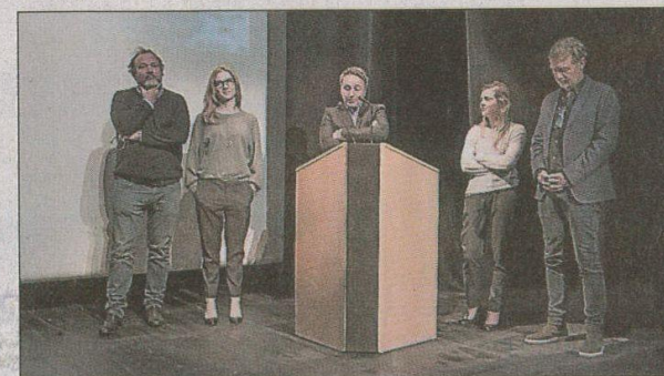
L'équipe de la série venue présenter les deux premiers épisodes.